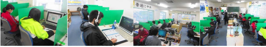
高校生も一生懸命取り組みます